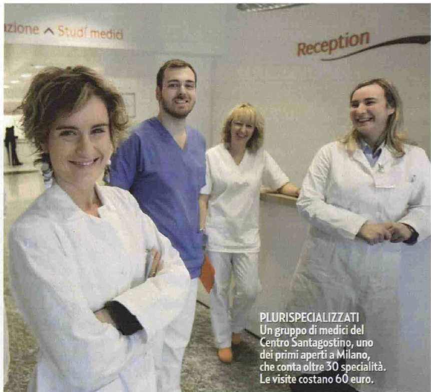
PLURISPECIALIZZATI Un gruppo di medici del Centro Santagostino, uno dei primi aperti a Milano, che conta oltre 30 specialità. Le visite costano 60 euro.

Ma qual è il trucco? «Il risparmio si ottiene grazie alle economie di scala», interviene Fabio Capasso, direttore della Scuola di formazione Continua del Campus Bio-Medico di Roma. «Concentrando più medici in un'unica struttura poliambulatoriale si ottiene la riduzione dei costi delle forniture e uno sfruttamento intensivo delle apparecchiature». Meno sprechi, tariffe più basse insomma. È questo l'assioma portante che ha dato inizio, in Italia, alle cure low cost. Nel 2008 Altroconsumo fotografò il "turismo odontoiatrico": 20mila pazienti che ogni anno, e ancora oggi, varcano i confini verso Ungheria, Croazia e Slovenia per devitalizzazioni, otturazioni, apparecchi. E per arginare il fenomeno alcuni imprenditori del Triveneto hanno creato strutture per evitare l'emigrazione di pazienti, come Progetto Dentale Apollonia, che oggi conta 5 centri tra Friuli e Veneto, e Venice Dental Service, che nella sede di Mestre inizierà a ospitare anche interventi di chirurgia estetica, sempre low cost, le- ▶