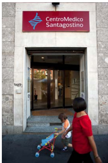
L'ingresso del Centro