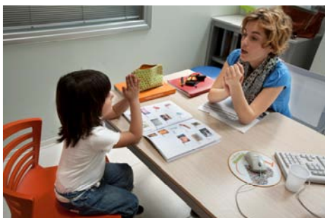
Una seduta di logopedia

Il Centro Medico Santagostino dispone di uno spazio bimbi e di un'ampia sala d'attesa con biblioteca, pc e area wi-fi. Un contesto accogliente per proporre il percorso di valutazione come esperienza accettabile e sostenibile per il bambino o il ragazzo e la sua famiglia.